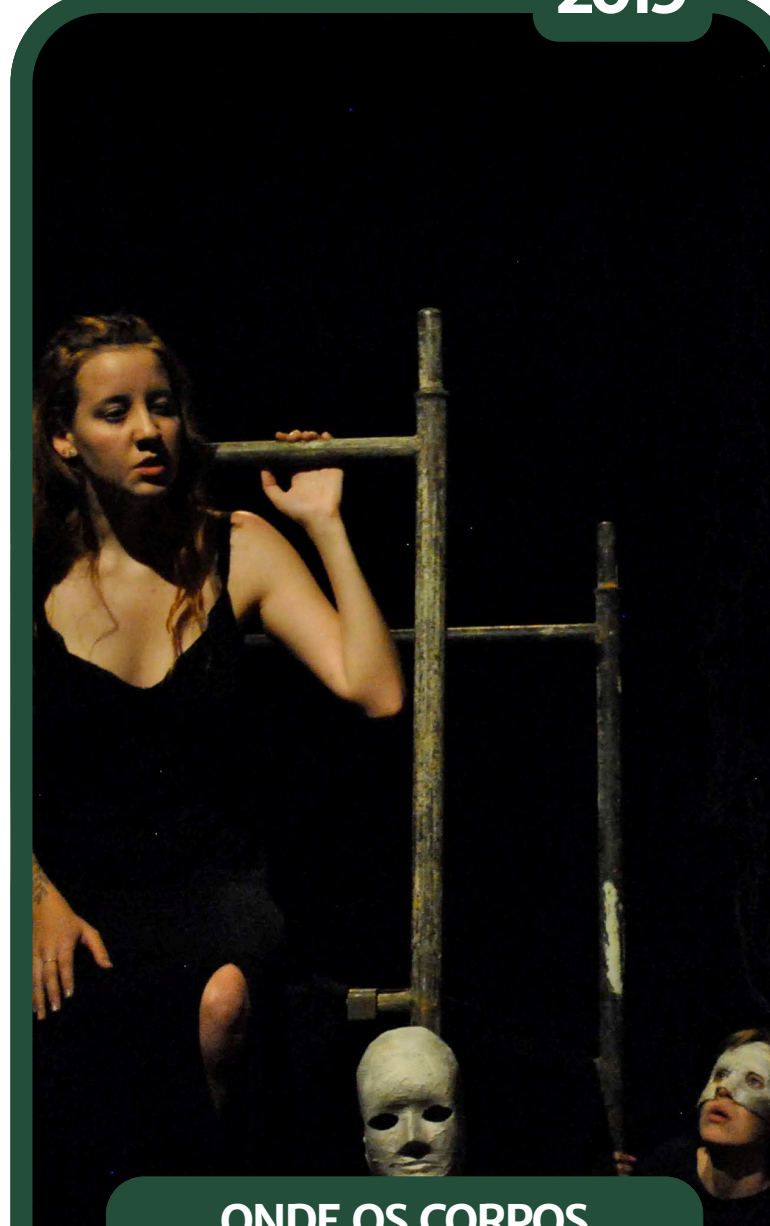
ONDE OS CORPOS NÃO BOIAM - CENÓGRAFA