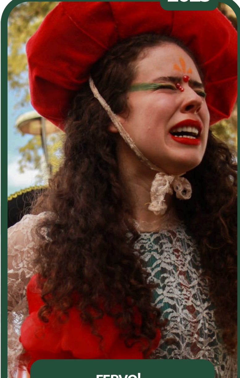
FERVO! – FIGURINISTA