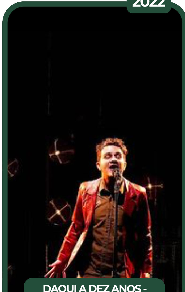
DAQUI A DEZ ANOS - ASSITSTENTE DE FIGURINO E CENOGRAFIA