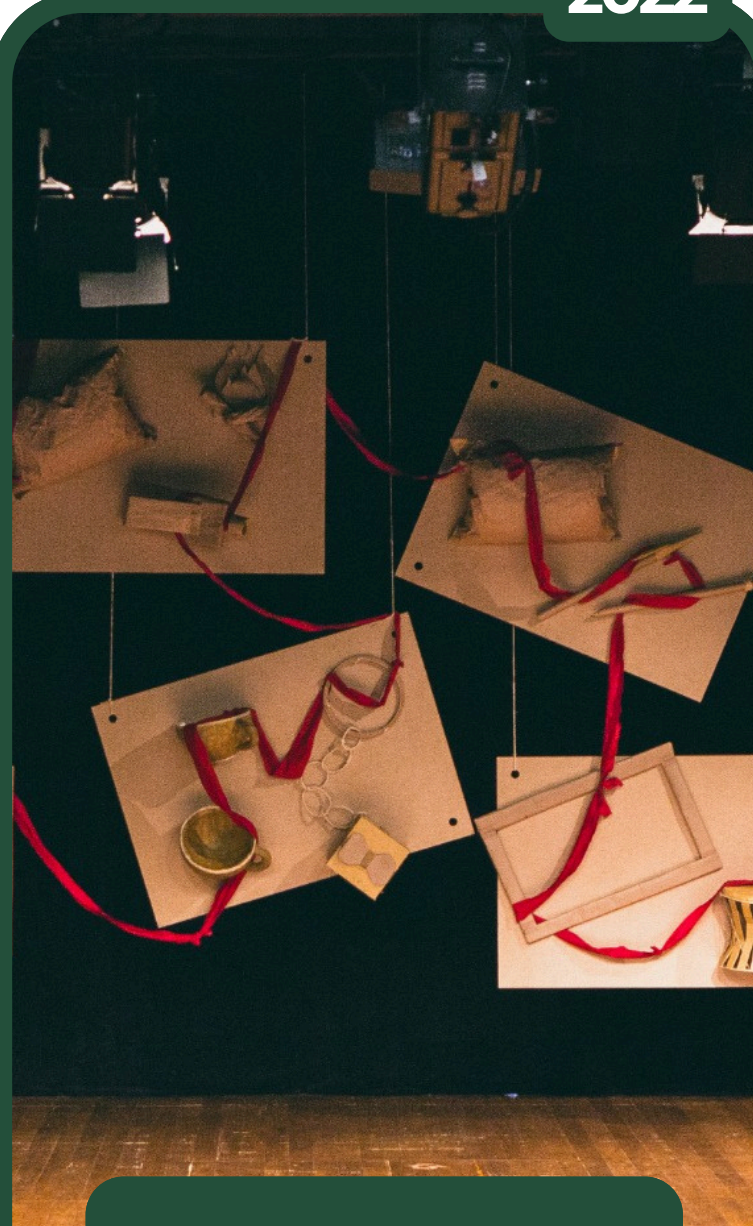
RETALHOS - CENÓGRAFA