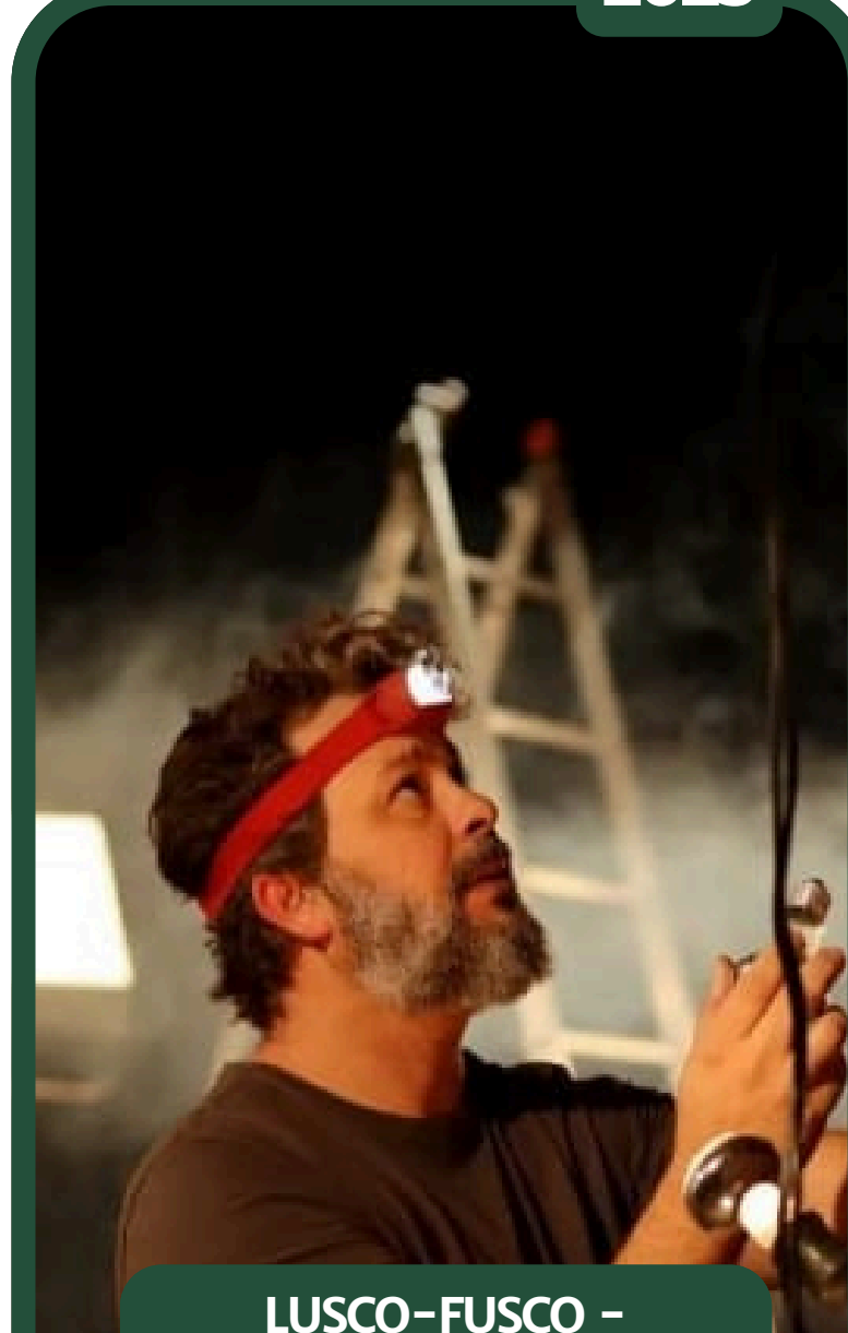
LUSCO-FUSCO – ASSISTENTE DE CENOGRAFIA