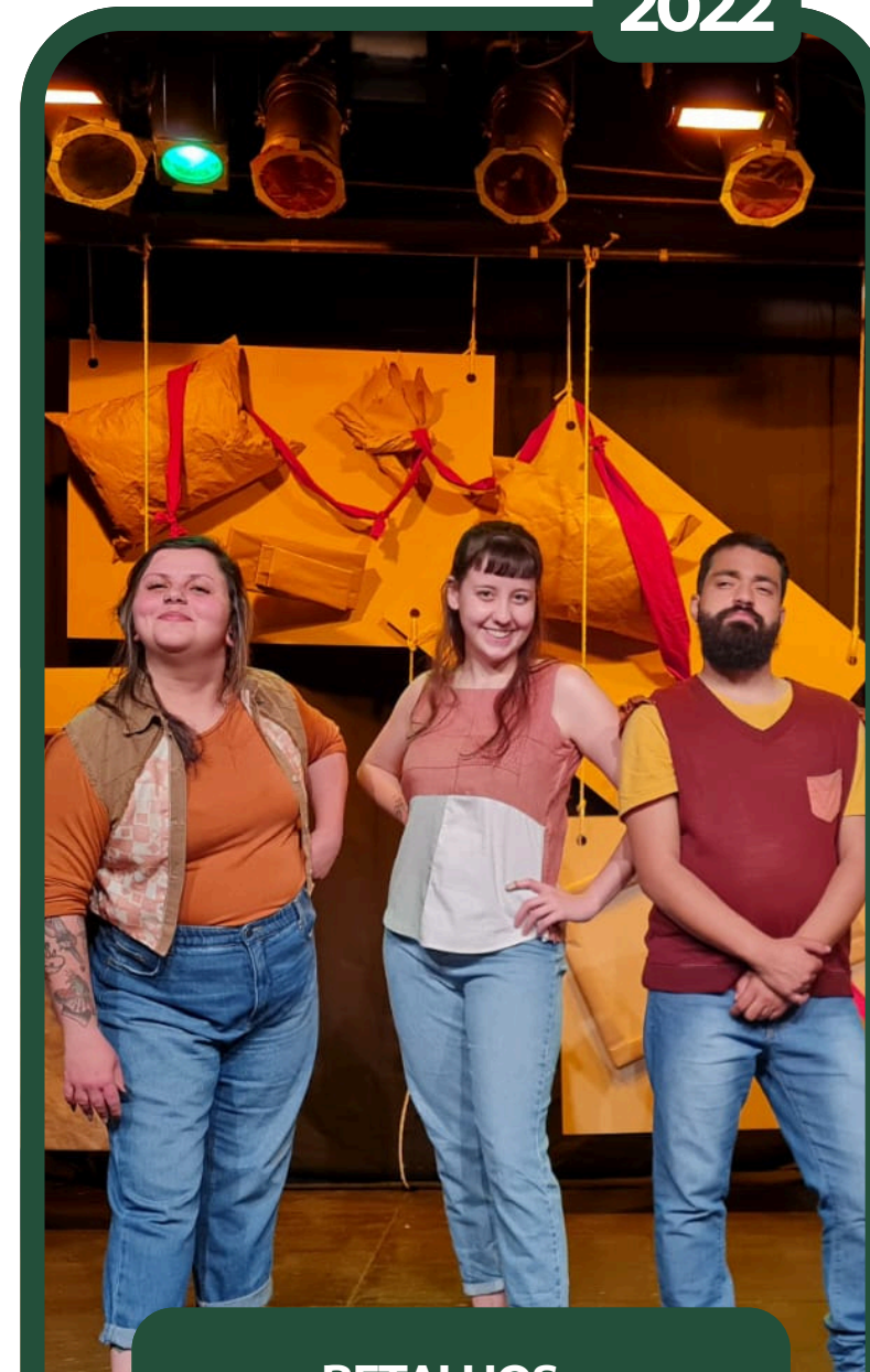
RETALHOS - FIGURINISTA