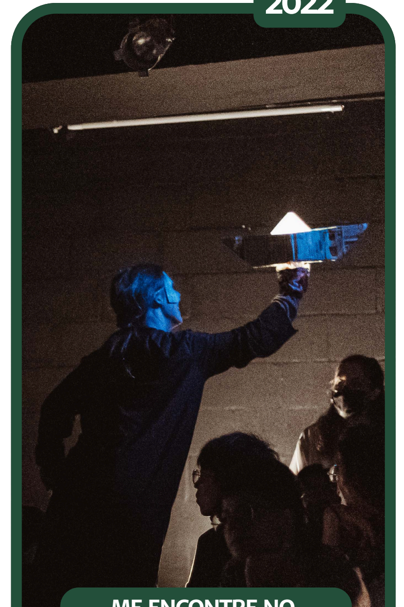
ME ENCONTRE NO ENTRE -DIRETORA E FIGURINISTA