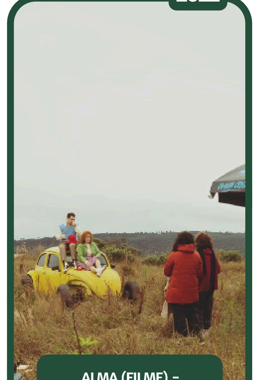
ALMA (FILME) – ASSISTENTE DE FIGURINO