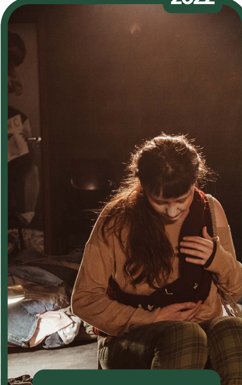
ME ENCONTRE NO ENTRE - CENÓGRAFA