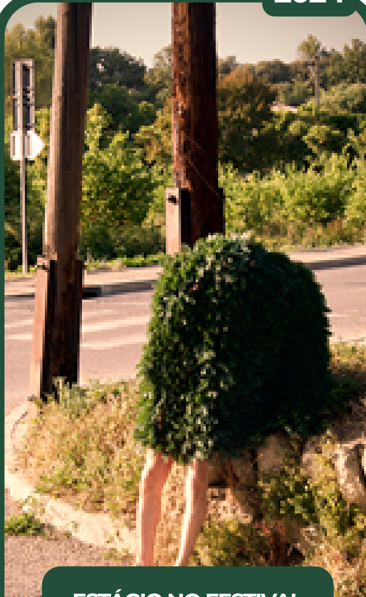
ESTÁGIO NO FESTIVAL MIMOS NA FRANÇA