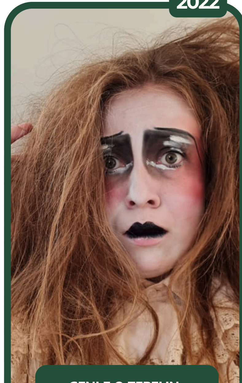
GENI E O ZEPELIN - SOLO ARTÍSTICO