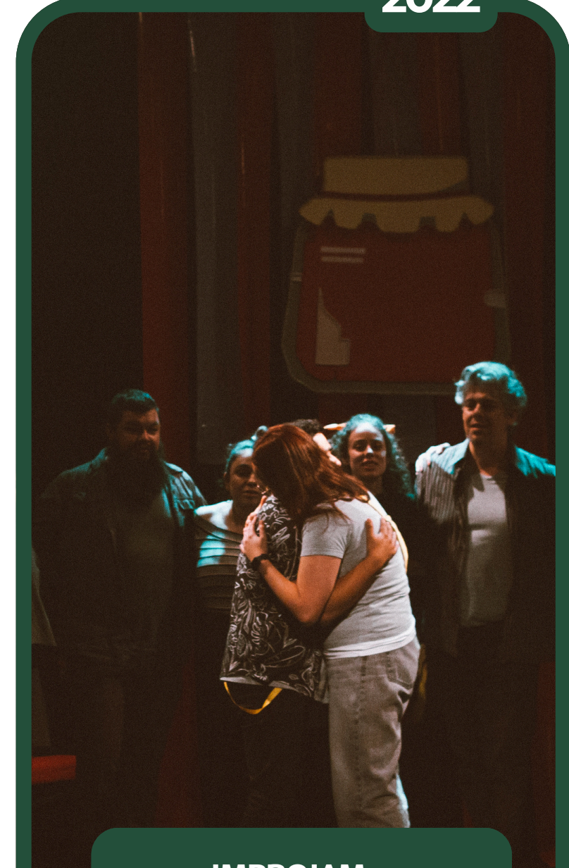
IMPROJAM - CENÓGRAFA