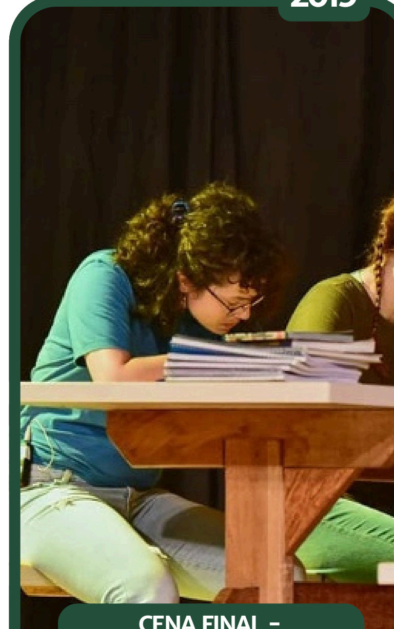
CENA FINAL - ASSISTENTE DE CENÓGRAFIA