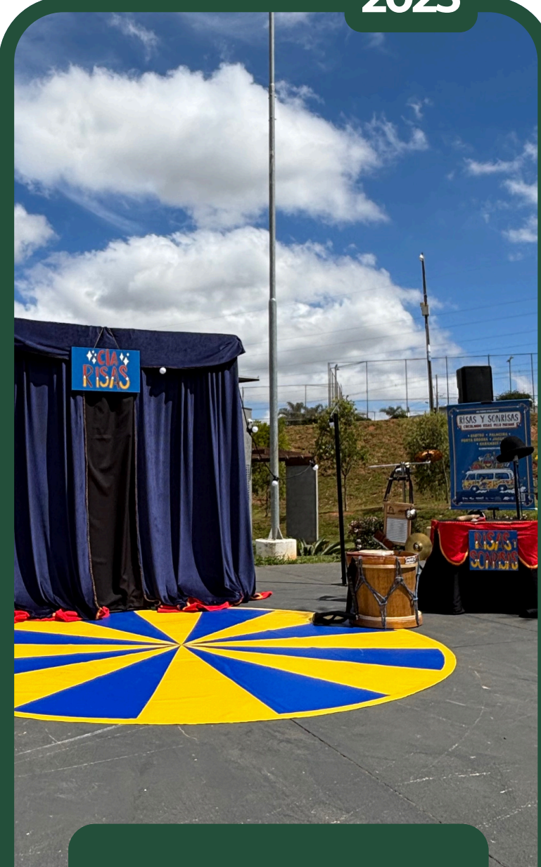
RISAS Y SONRISAS - CENÓGRAFA